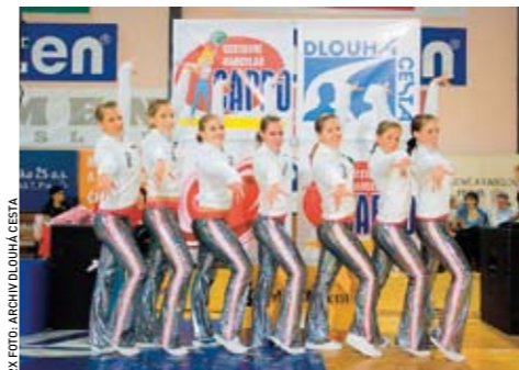
Loňská sportovní Neděle pro vaše srdce, jejíž výtěžek podpořil občanské sdružení Dlouhá cesta. Letos se benefice koná znovu 9. listopadu.

Ve Velké Británii mají podobných organizací, jako je Dlouhá cesta, asi sedm. „Existují tam organizace speciálně na pomoc těm, kterým vzala dítě nemoc, nebo těm, jejichž blízký